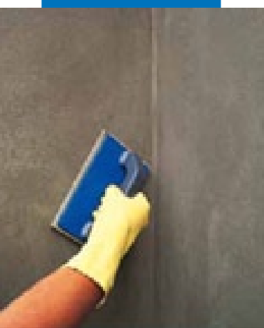
Финишная обработка губчатой теркой